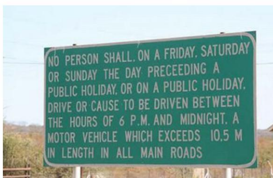
Formulaire de sortie d'hôpital