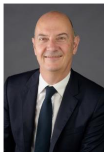
Roland Lescure Ministre délégué chargé de l'Industrie

Après le succès de la première vague de dix-huit lauréats annoncés en novembre 2022, nous sommes particulièrement heureux de saluer les 13 nouvelles start-ups et PME industrielles lauréates de l'appel à projets « Première Usine », dans le cadre de France 2030. Nous leur souhaitons la plus grande réussite dans la réalisation de leur projet et dans la conquête de leur marché