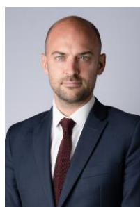
Jean-Noël Barrot Ministre délégué chargé de la Transition numérique et des Télécommunications

Le ministère de l'économie, des finances et de la souveraineté industrielle et numérique, avec le Secrétariat général pour l'investissement et Bpifrance, souhaite convertir le potentiel d'innovation en potentiel industriel, et ainsi encourager l'implantation sur le territoire de premiers sites industriels destinés à des productions innovantes.