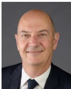
Roland LESCURE , Ministre délégué en charge de l'industrie

Nous sommes particulièrement heureux de saluer les 18 start-ups et PME industrielles lauréates de la première vague de l'Appel à projets Première Usine .