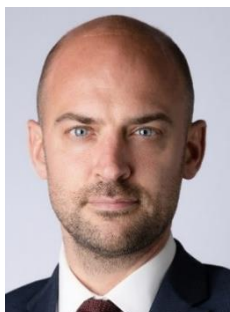
Jean-Noël BARROT , Ministre délégué chargé de la Transition Numérique et des Télécommunications

Les opérateurs et services de l'Etat, notamment le nouveau guichet start-ups industrielles de la Mission French Tech, jouent également un rôle-clé pour accompagner ces acteurs émergents dans l'ensemble de leurs démarches, et notamment dans l'établissement de leurs sites industriels. Nous assurons ainsi un suivi personnalisé de ces entreprises dans un processus parfois complexe. Il sera renforcé dans les prochaines semaines pour que les lauréats de l'Appel à projets Première Usine bénéficient d'un accompagnement renforcé de la Mission French Tech à partir de début 2023.